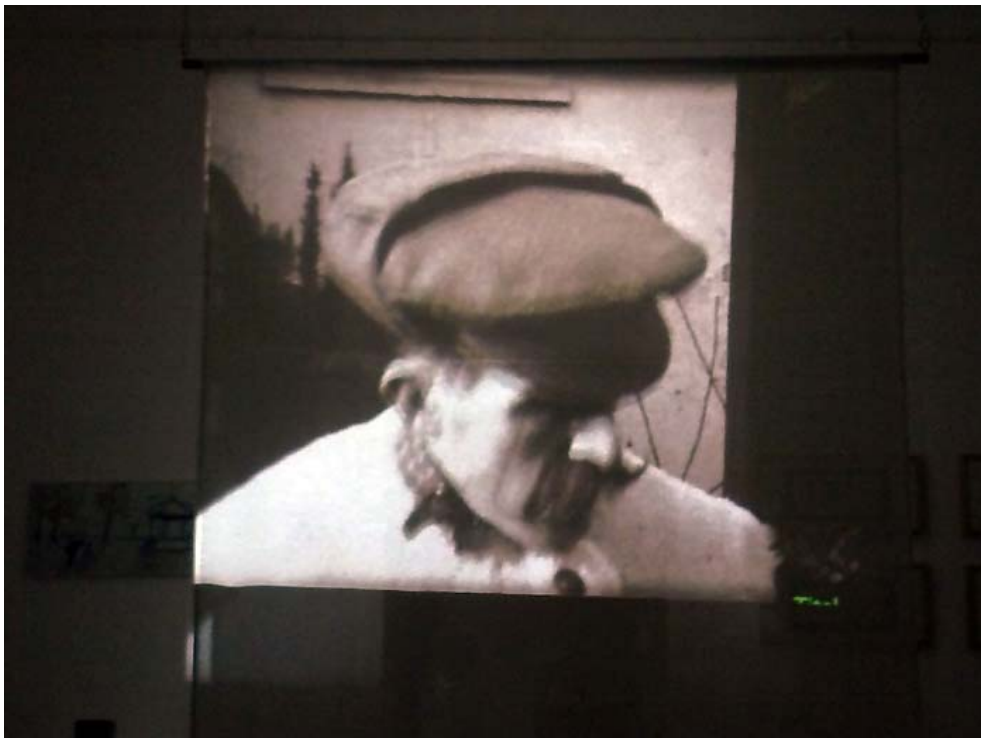
Billy Childish, super 8 still

In der Galerie ZERO von Anna Krenz und Jacek Slaski in Berlin-Kreuzberg stellt Howard Fotos aus, die er mit einer Lochkamera aufgenommen hat. Eine kleine würfelförmige Camera obscura, die er für 20 Pfund auf dem Flohmarkt erstanden hat. Licht fällt durch ein kleines Loch auf die Rückwand der schwarzen Box im Inneren und erzeugt nicht nur ein typisch atmosphärisches Foto, sondern auch jedes Mal ein Unikat. Howard muss die Klappe nur lang genug auflassen. Da kann man zwischendurch schon mal eine neue Kanne Tee aufsetzen, nur das Motiv muss stillhalten.