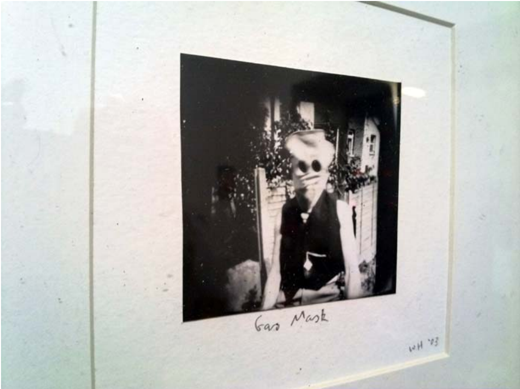
Wolf Howard, pinhole photograph