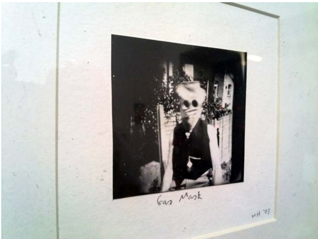
Wolf Howard, pinhole photograph