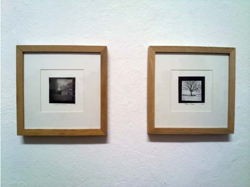
Wolf Howard, pinhole photographs