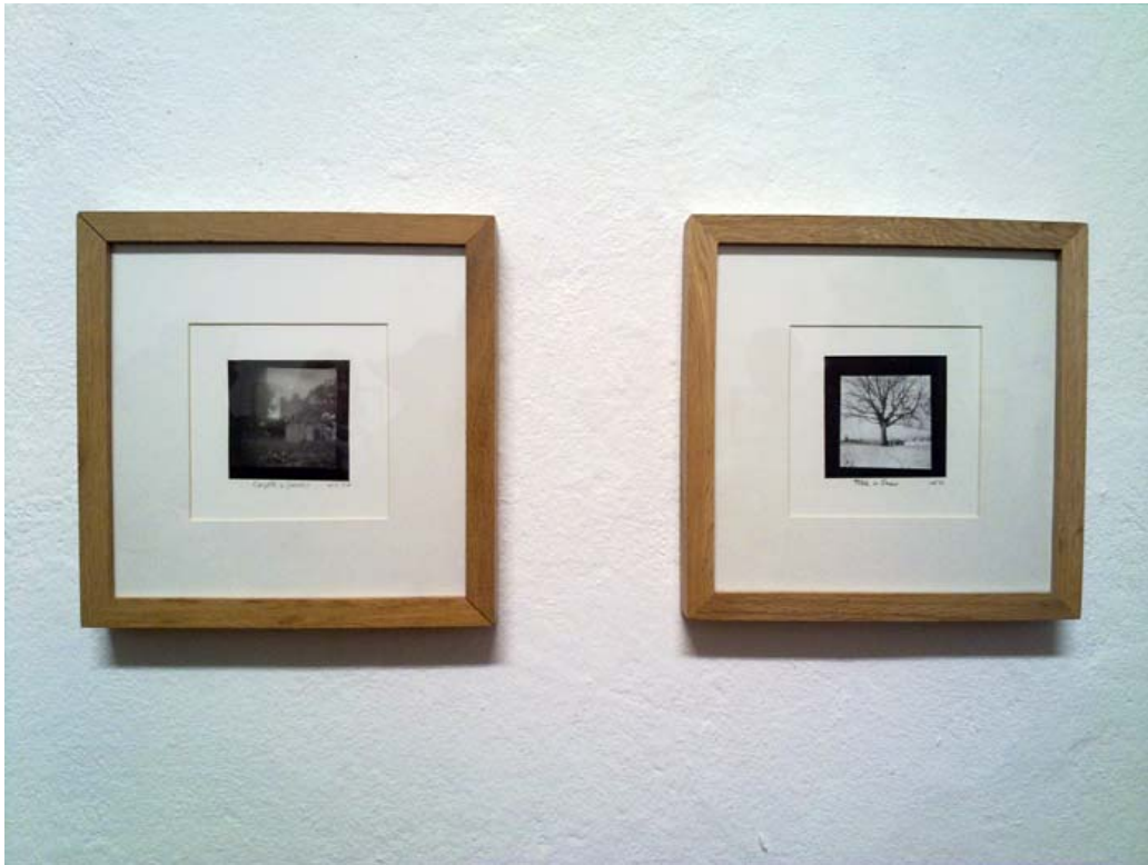
Wolf Howard, pinhole photographs